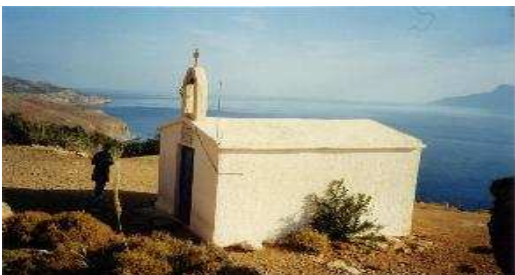
Eglise d'Aghia Eirini